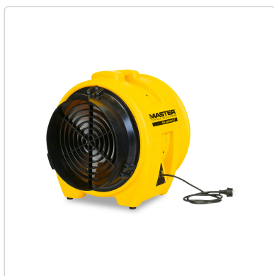
Master BL 8800 – ventiladores extractor de aire profesional