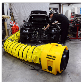
Master BL 8800 taller de garaje