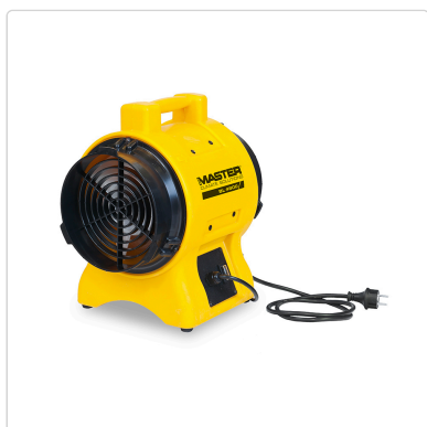
Master BL 4800 – ventiladores extractor de aire profesional