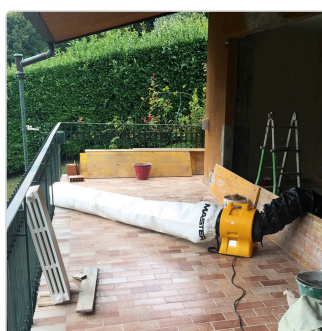
Master BL 4800 con bolsa de polvo